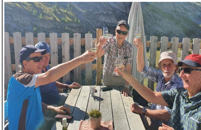
Apéro auf der Terrasse im Schwarzbach